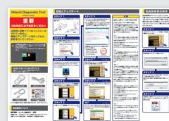
クイックスタートガイド